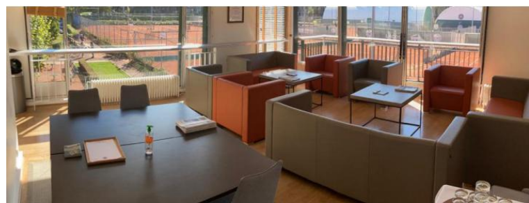
SALLE AUSTRALIAN OPEN - 40M 2