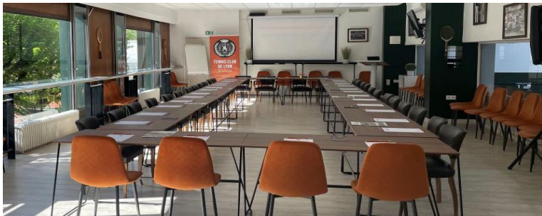
SALLE HENRI COCHET - 100M 2

Le club accueille vos événements d'entreprise entreprise@tennisclubdelyon.com