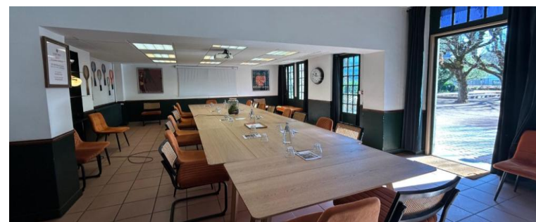
SALLE ROLAND GARROS - 50M 2